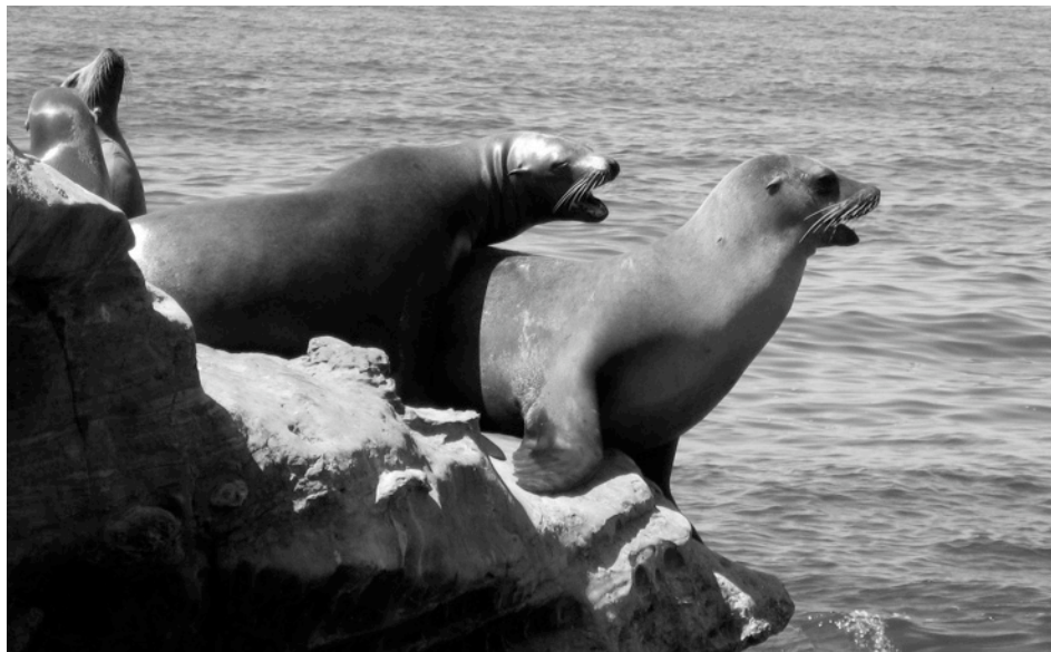
Marleonoj kutime sunbaniĝas sur la rokoj en la golfeto La Jolla Cove.

● la multaj plaĝoj en Sandiego: Mission Beach, Ocean Beach, Pacific Beach, Windansea Beach , ktp.