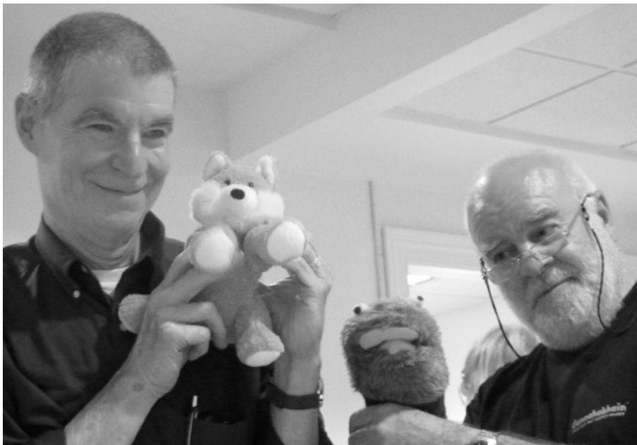
Ne nur infanoj amas pluŝbestojn. Ankaŭ NASK-instruistoj.

“Chez Esperanto-Englewood is a home filled with an Esperanto flag (green star on a white background), T-shirts, hats, photos, a framed portrait of Zamenhof and many shelves of books, hundreds of Esperanto books.”